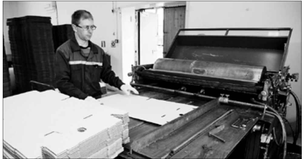
■ УПП выпускает продукцию из картона, в том числе коробки для пиццы, папки-скоросшиватели, пакеты и конверты.

Создание условий для загрузки Архангельского учебно-производственного предприятия, где работают люди с ограниченными возможностями здоровья, обсудили на расширенном совещании под руководством главы области.