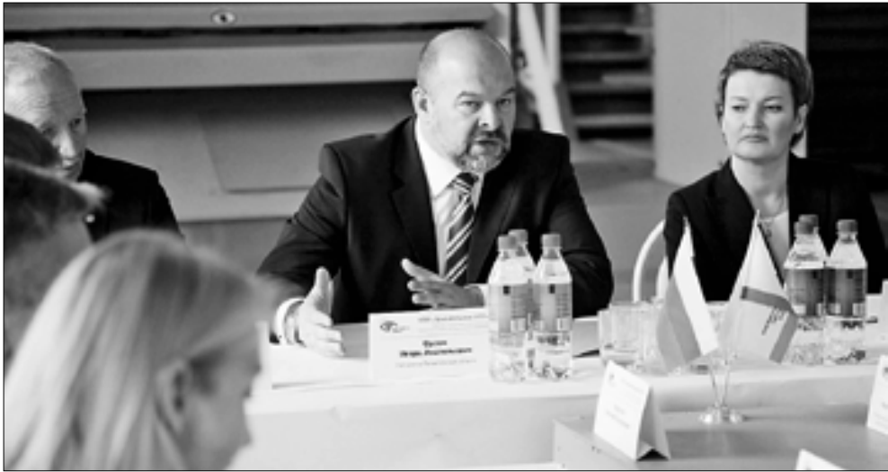
■ Игорь Орлов: «Предприятие выполняет важную социальную функцию, решая вопросы занятости людей с инвалидностью».

Приоритеты: Губернатор Игорь Орлов призвал обратить внимание на загрузку предприятий, дающих рабочие места для людей с ограниченными возможностями