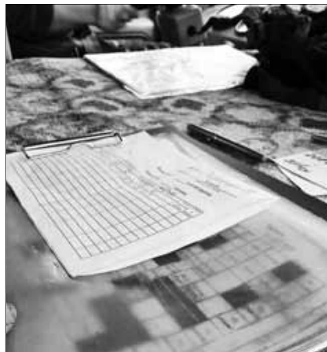
■ Билетно-учетный лист – главный документ.

Вообще, они с Назаром работают в паре уже давно, поэтому с планом справляются